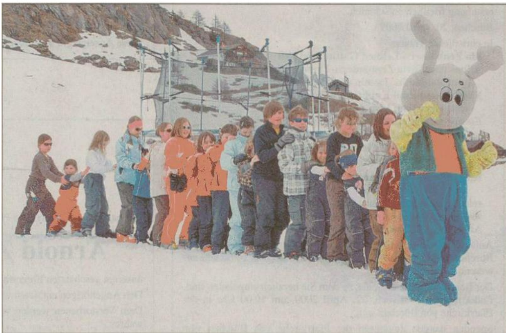
Snowli sorgte am Samstag für stimmungsvolle Unterhaltung im Kinderland.